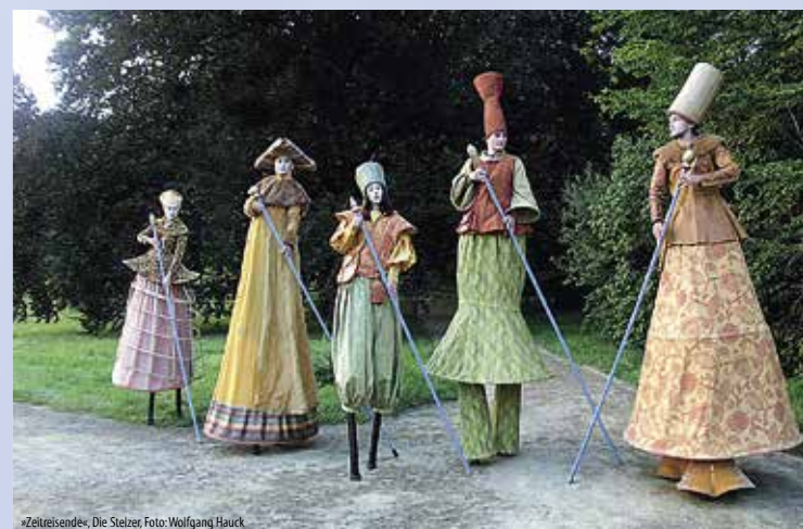
»Zeitreisende«, Die Stelzer, Foto: Wolfgang Hauck