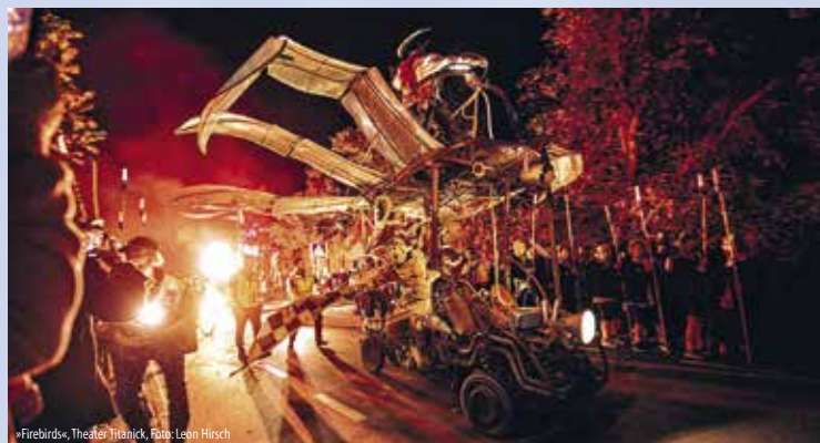
»Firebirds«, Theater Titanick, Foto: Leon Hirsch