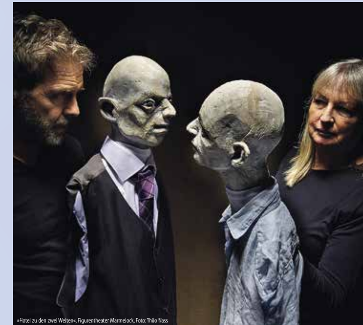
»Hotel zu den zwei Welten«. Figurentheater Marmelock