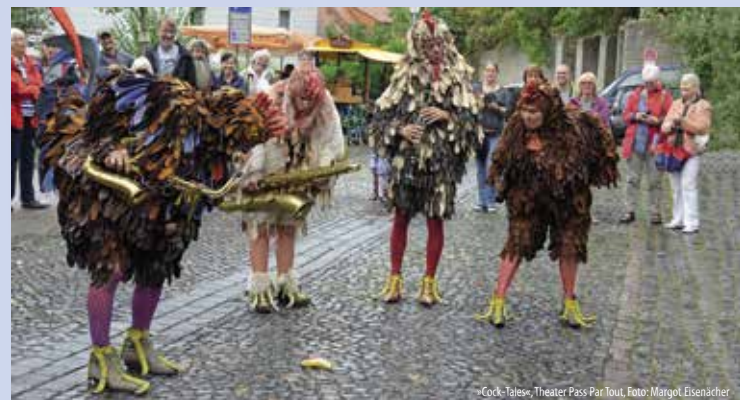
»Cock-Tales«, Theater Pass Par Tout, Foto: Margot Eisenacher